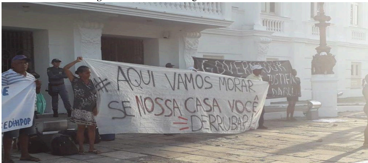
Figura 2 – Protestos do Agosto Violento em 2019